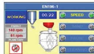
Affichage de la séquence de malaxage