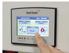
Ecran tactile 4.3"