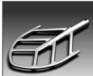
Batteur en acier inoxydable