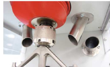
Ecoulement du sablier ou additif et système d'accroche rapide du batteur