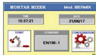
Interface utilisateur optimisée